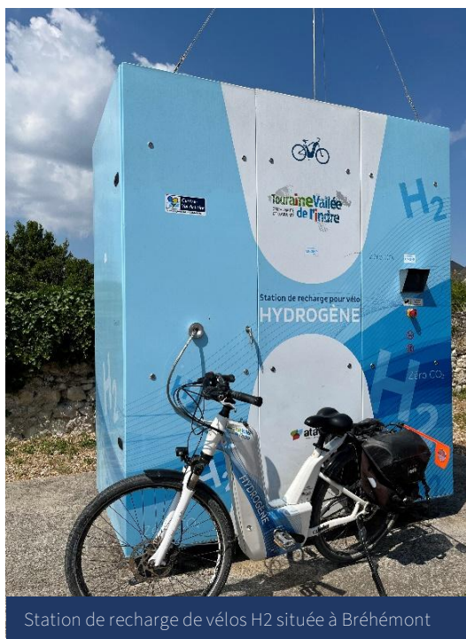
Station de recharge de vélos H2 située à Bréhémont

A l'heure actuelle il n'existe qu'une station de recharge située rue des déportés, 37140 Bréhémont. Selon les faisabilités techniques et le candidat retenu, celle-ci pourra être amenée à être déplacée aux alentours d'Azay-le-Rideau. Il est prévu courant 2025-2026, le déploiement d'une autre station de recharge du côté de Montbazou-Veigné (lieu exact à déterminer).